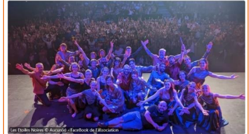
Les Étoiles Noires © Aucourci - Facebook de l'Association

Cyril Seguin Diffusé le jeudi 2 mai 2024 à 10:03 Publié le jeudi 2 mai 2024 à 10:03