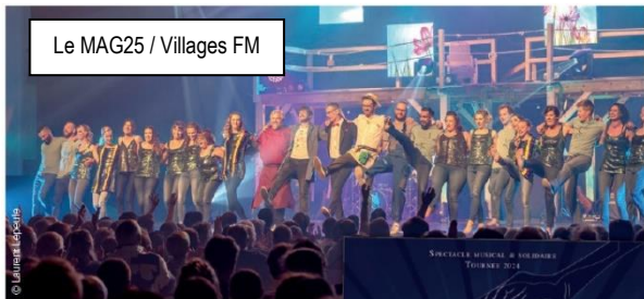
Le MAG25 / Villages FM

Comme à leur habitude, Les Étoiles Noires ont débuté leur tournée à Villers-Le-Lac avec un tout nouveau spectacle « Quelque Chose de Magique ».